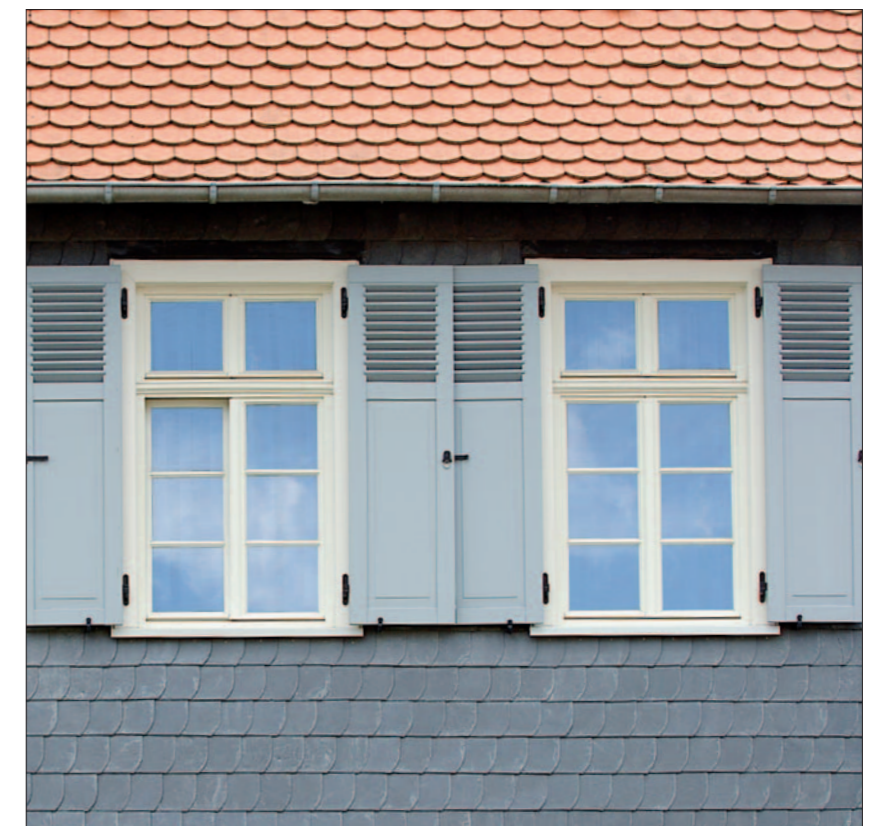
PaXretro mit Fensterbekleidung und Läden in einem barocken Herrenhaus von 1663.

Und um ein möglichst authentisches Erscheinungsbild zu erzielen, kann bei PaXretro in der Regel sogar die Profilierung wieder an die historische Vorlage angeglichen werden.