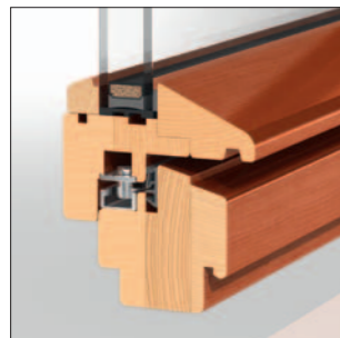
Weniger ist mehr: Der verleimte und von unten unsichtbar verschraubte Wetterschenkel – aus Hartholz – ist bis zur Glasebene durchlaufend.